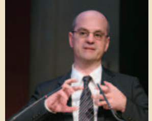
Jean-Michel Blanquer , Directeur Général de l'ESSEC