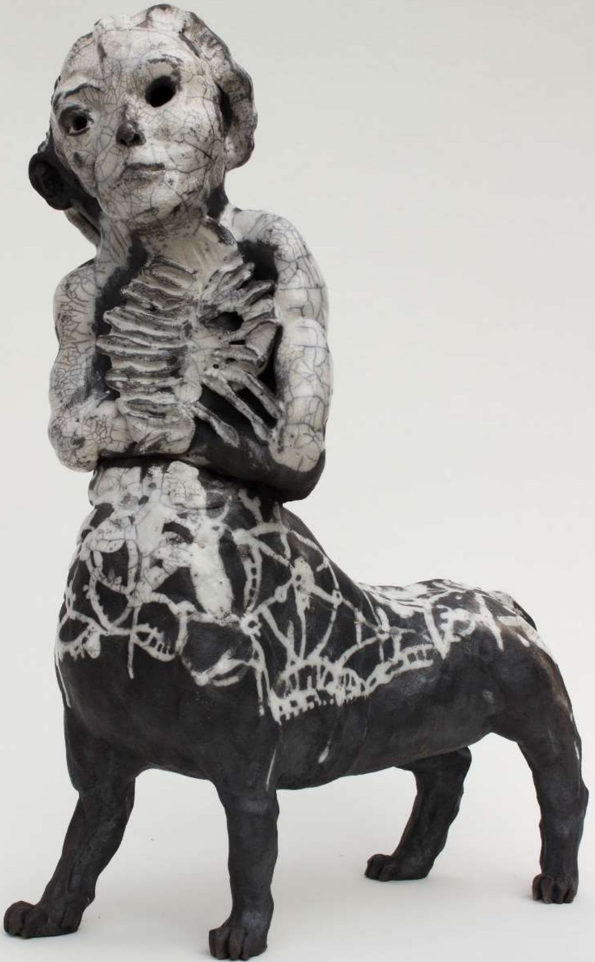
SylC, Humanimal #2 Céramique raku – 56 x 38 x 19 cm / 2018