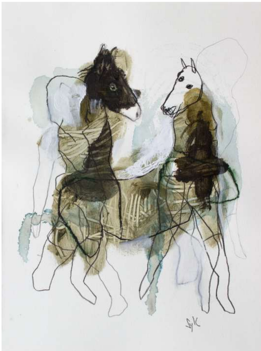
SylC, Dessin, Avec ou sans cavalier #1 Fusain, acrylique et pastel gras sur papier - 40 x 30 cm / 2018