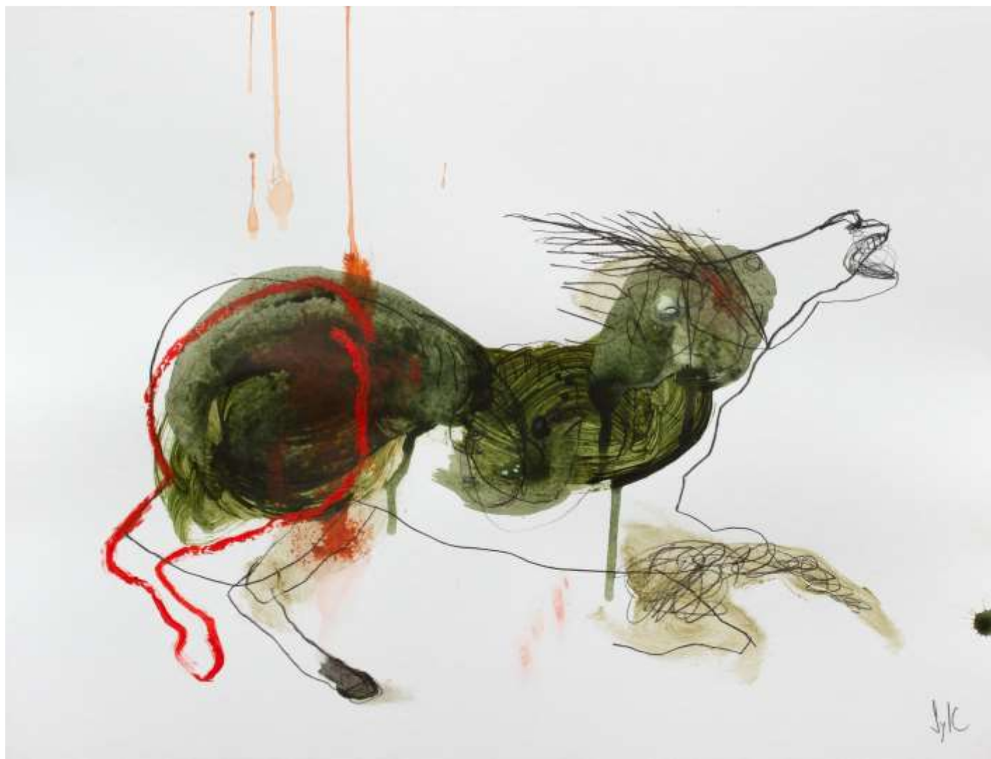
SylC, Dessin, Horse #2

Fusain, acrylique et pastel gras sur papier – 50 x 65 cm / 2018