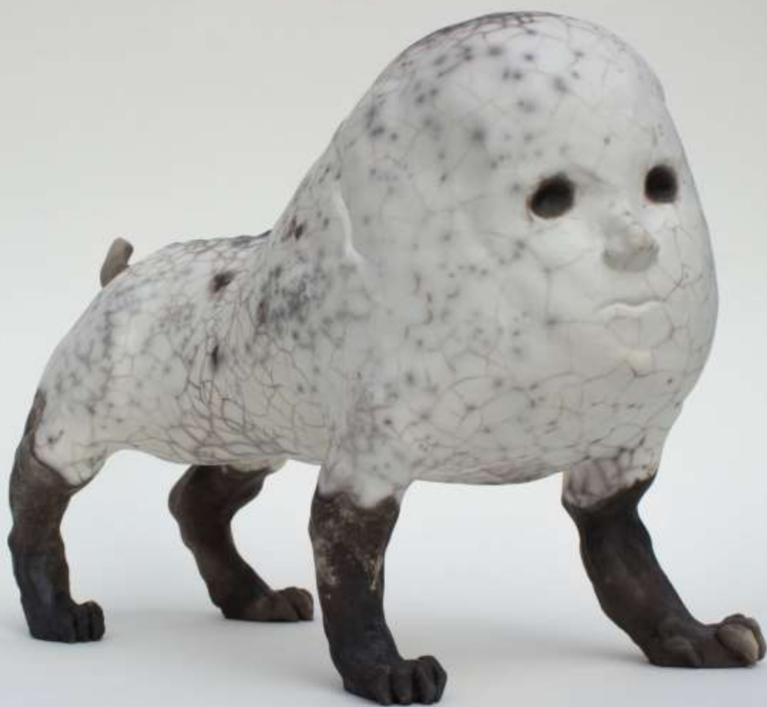
SylC, Humanimal #4 Céramique raku – 29 x 37 x 18 cm / 2018