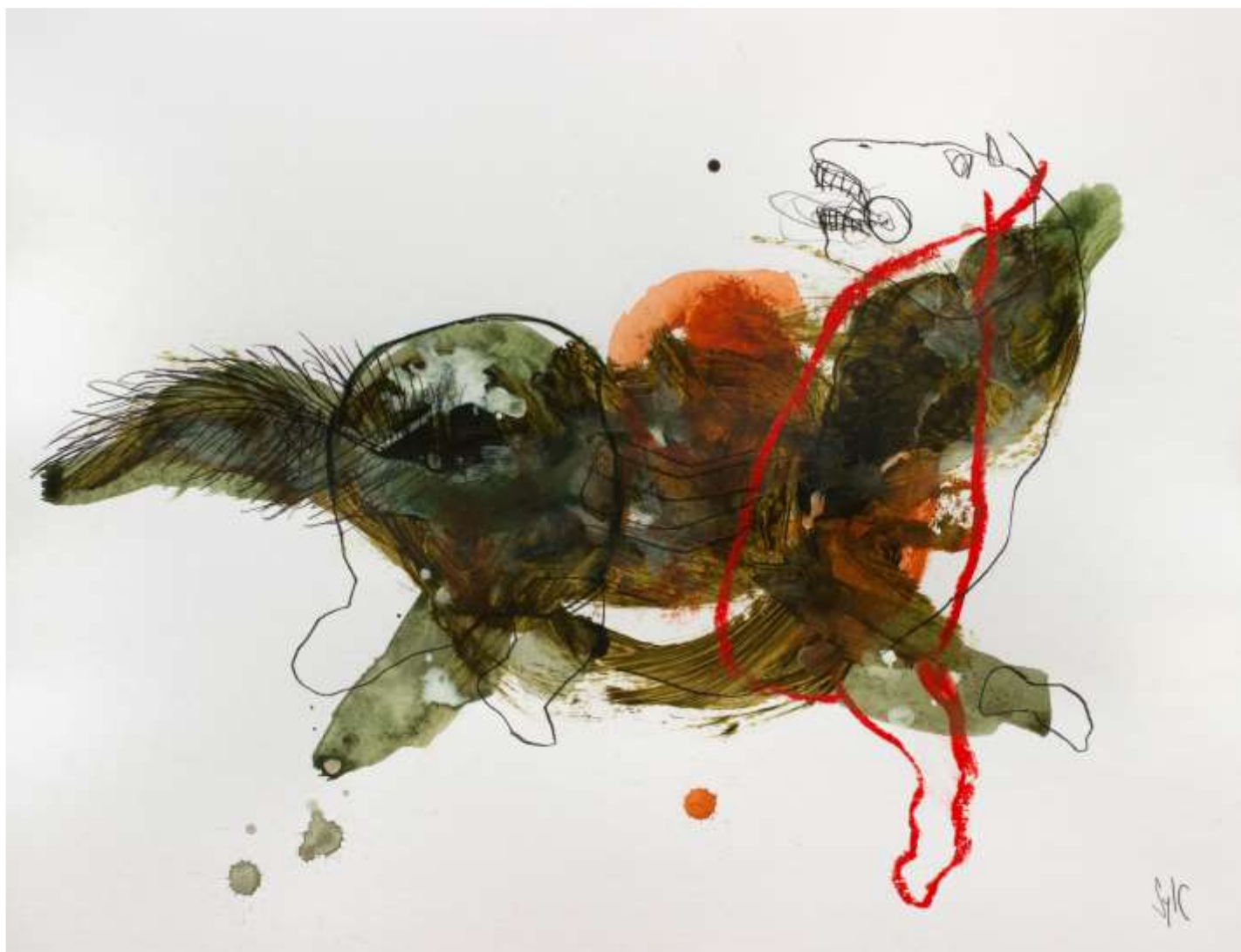
SylC, Dessin, Horse #1 Fusain, acrylique et pastel gras sur papier – 50 x 65 cm / 2018