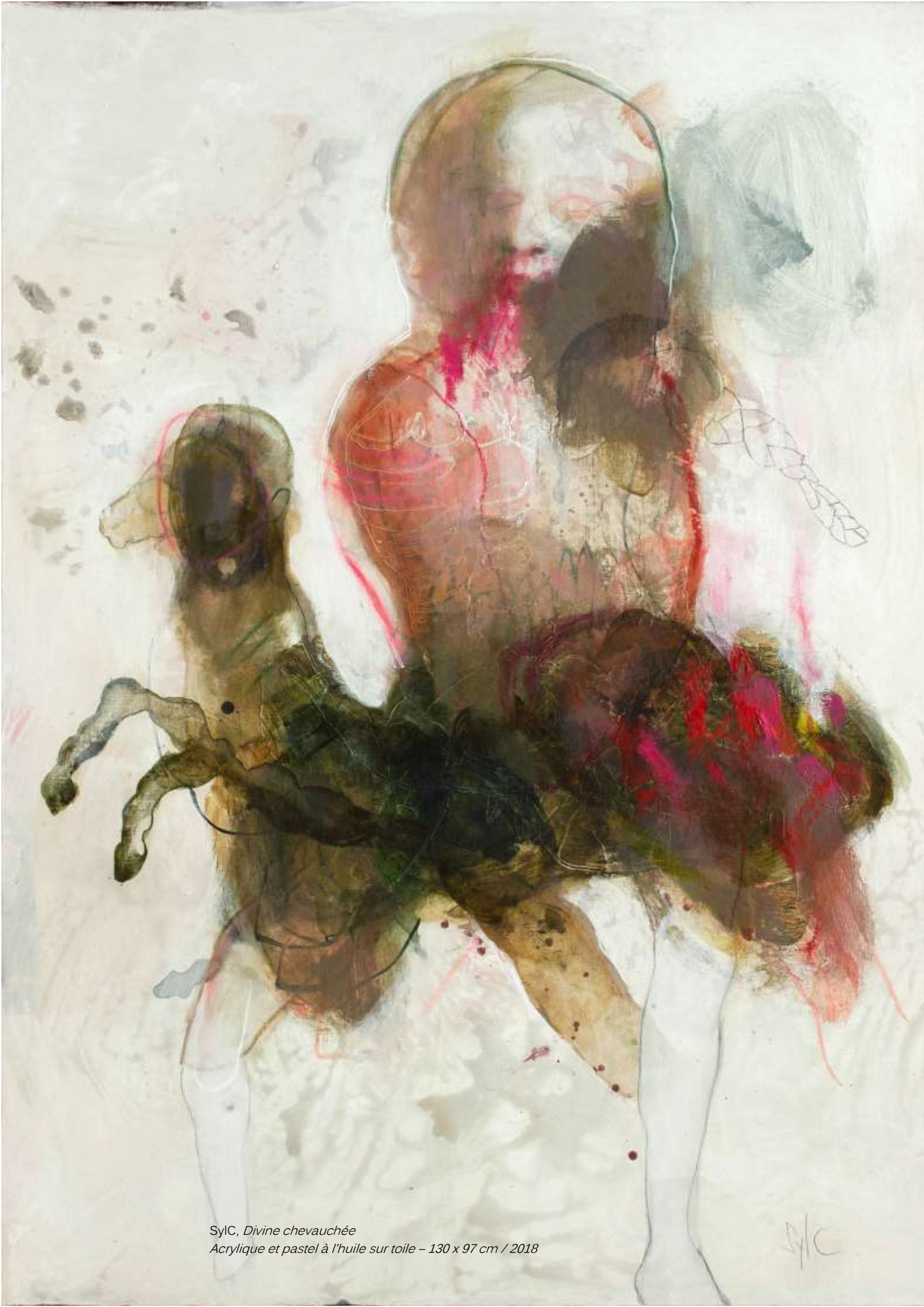
SyLC, Divine chevauchée Acrylique et pastel à l'huile sur toile – 130 x 97 cm / 2018