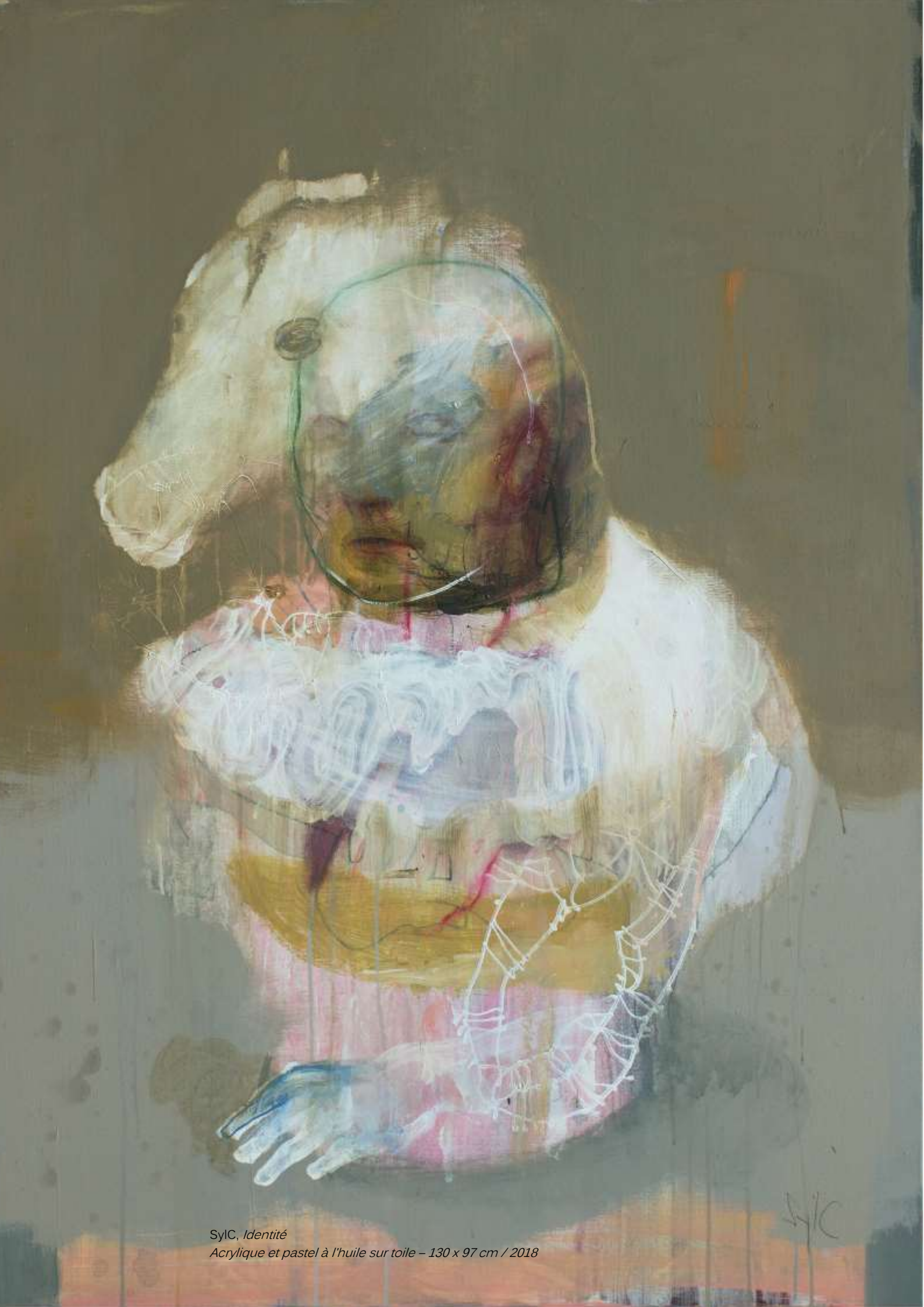
SYC, Identité Acrylique et pastel à l'huile sur toile - 130 x 97 cm / 2018