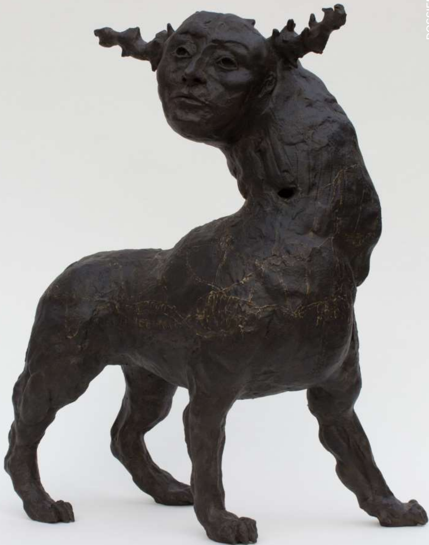
SylC, Humanimal #1 Céramique patinée – 49 x 39 x 19 cm / 2018