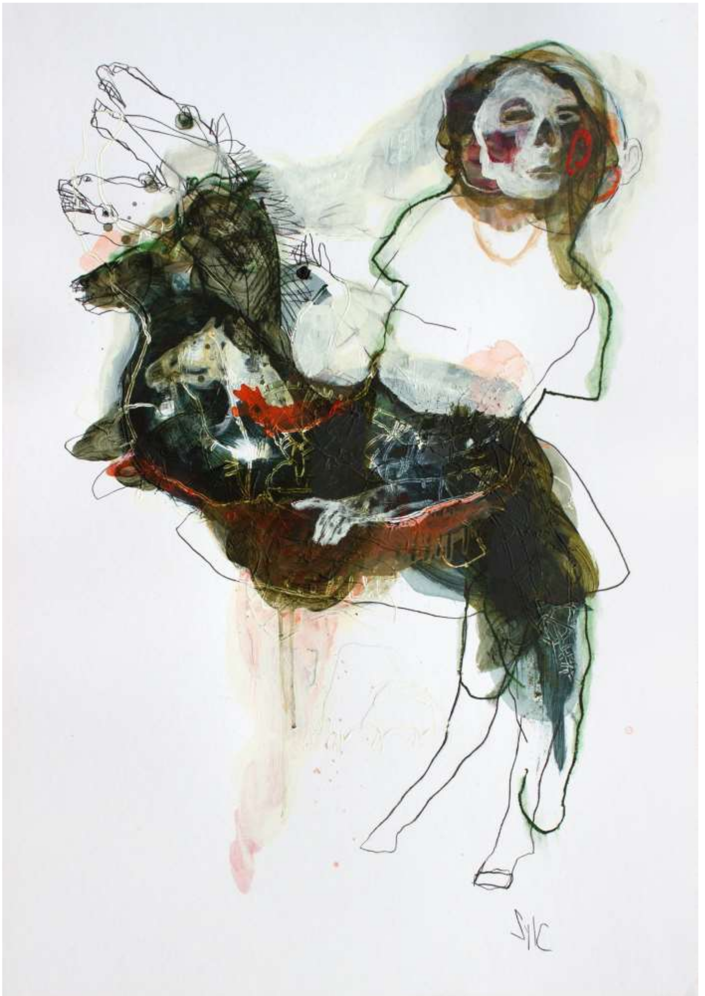
SylC, Dessin, Five-headed horse Fusain, acrylique et pastel gras sur papier – 100 x 70 cm / 2018