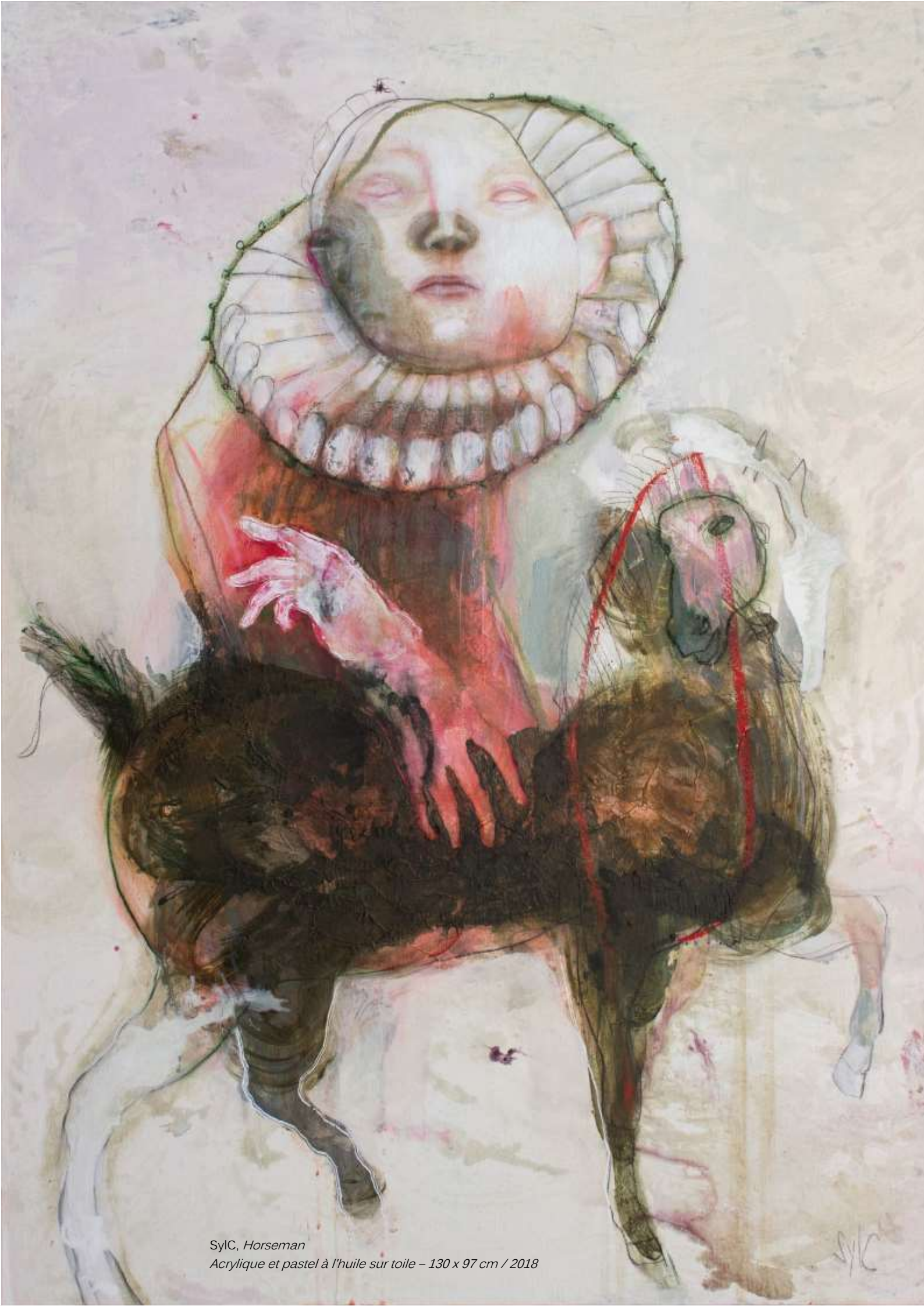
Sylc, Horseman Acrylique et pastel à l'huile sur toile – 130 x 97 cm / 2018