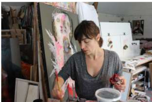
SylC, vue d'atelier

Présente dans des collections publiques (Ville de la Rochelle, Ville du Mans) et privées, SylC est lauréate de prix en Suisse et en France, dont deux décernés par la Fondation Taylor. Quatre monographies ont été publiées sur ses travaux, dont les deux dernières en 2015 et 2016.