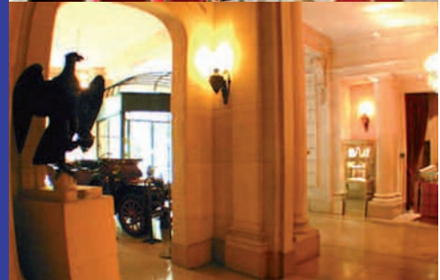
les salons des Arts et Métiers